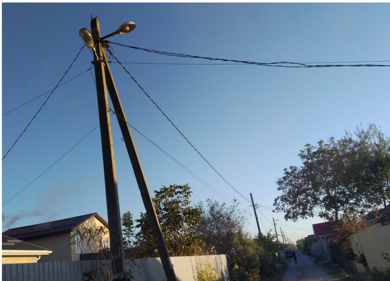
Фото. ТОРСАДА УЛИЦА ВИШНЕВАЯ.