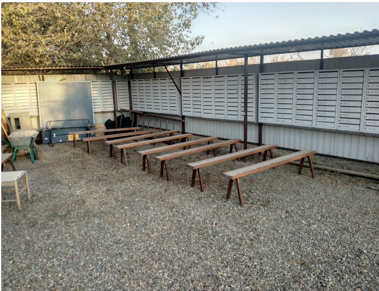
Фото. ПРАВЛЕНИЕ СНТ № 2 АО «ЮГТЕКС» ул. САДОВАЯ,568