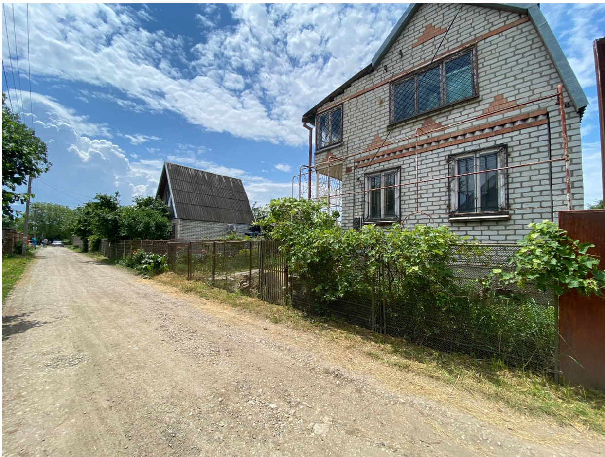
Фото. ОБКОСЫ ЗЕМЕЛЬ ОБЩЕГО ПОЛЬЗОВАНИЯ.