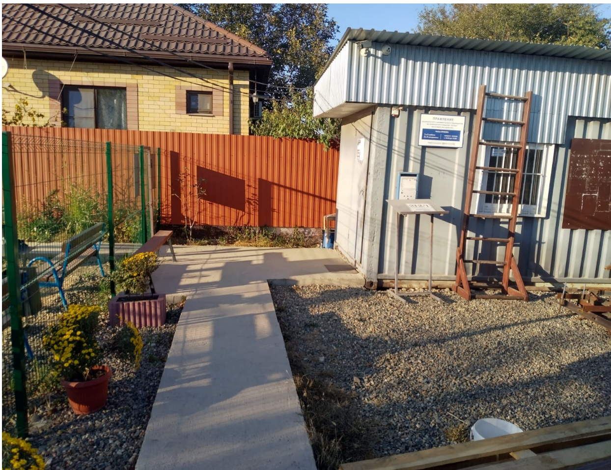
Фото. ПРАВЛЕНИЕ СНТ № 2 АО «ЮГТЕКС» ул. САДОВАЯ,568